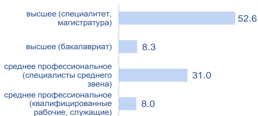
Структура выпускников по уровням образования