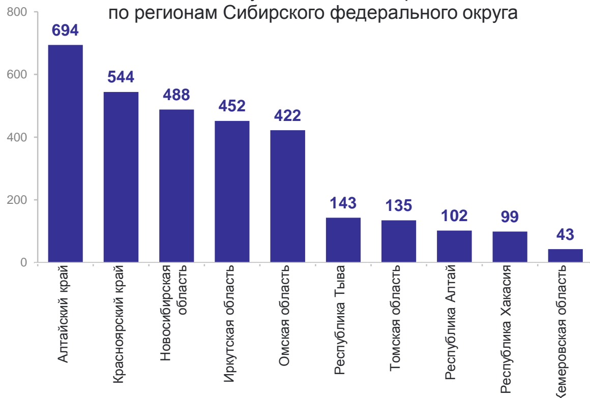
Количество муниципальных образований по регионам Сибирского федерального округа