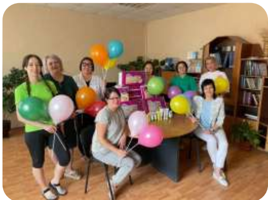
Передача средств гигиены и проведение познавательно-развлекательной программы для детей из БУЗ РА «Специализированный дом ребенка» в с. Манжерок Республики Алтай