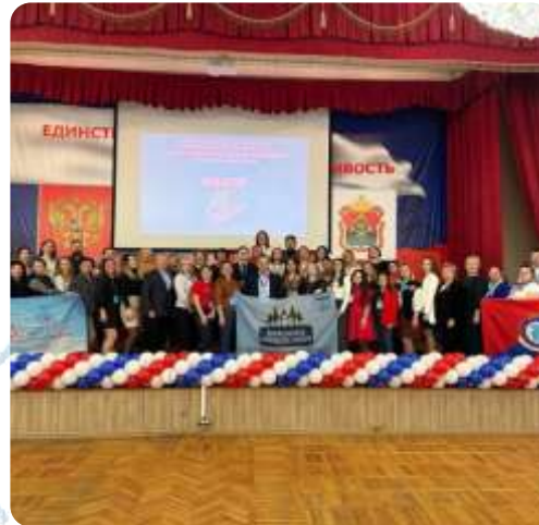
Окружной этап конкурса Стратегический резерв