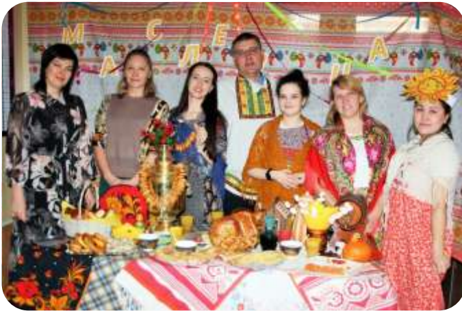
День защитника Отечества и Масленица