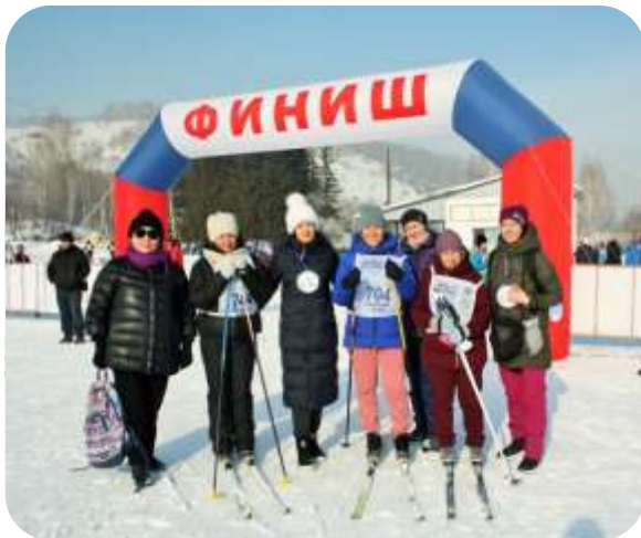
Лыжные гонки, 2 место

Алтайкрайстат ежегодно участвует в спартакиаде трудовых коллективов города Горно-Алтайска