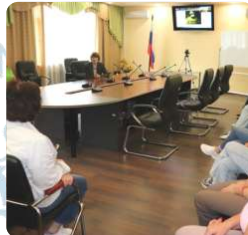
«История российского флага»