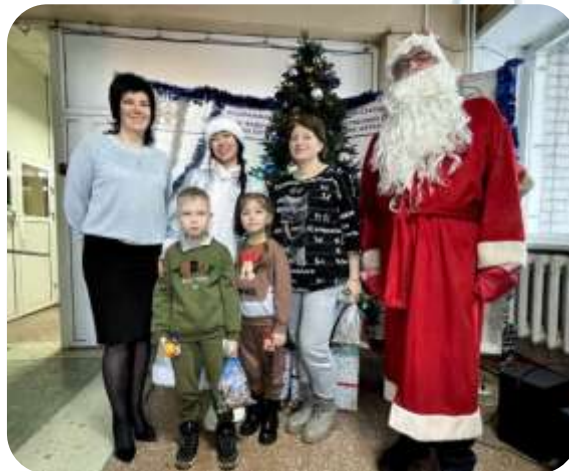
Поздравление подшефных детей погибшего участника СВО