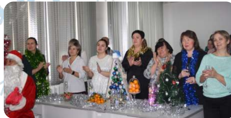
Новогодний телемост с коллегами Алтайкрайстата