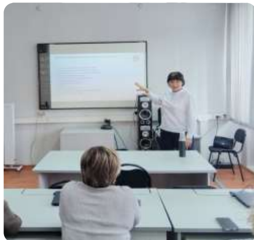
«Стресс и его влиянии на развитие современной личности»