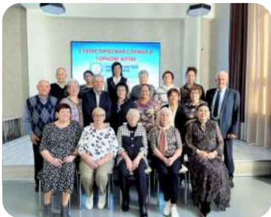
Встреча ветеранов статистики Республики Алтай в Национальной библиотеке им. М.В. Чевалкова