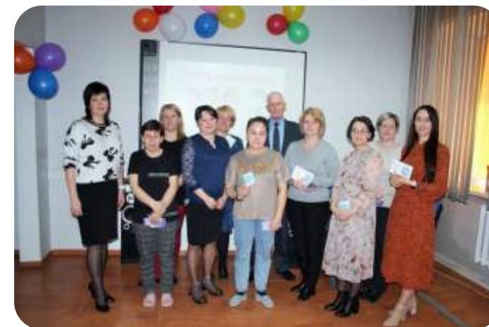
Награждение спортсмена-статистика памятным знаком «Гордость коллектива»