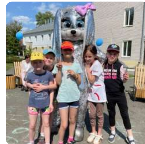
Праздник для детей в преддверии Дня защиты детей