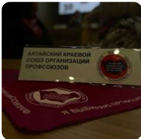
Квиз-игра, посвященная истории России