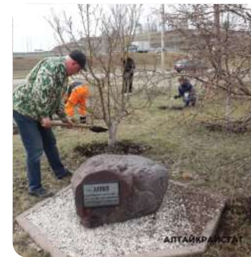
Всероссийская экологическая акция