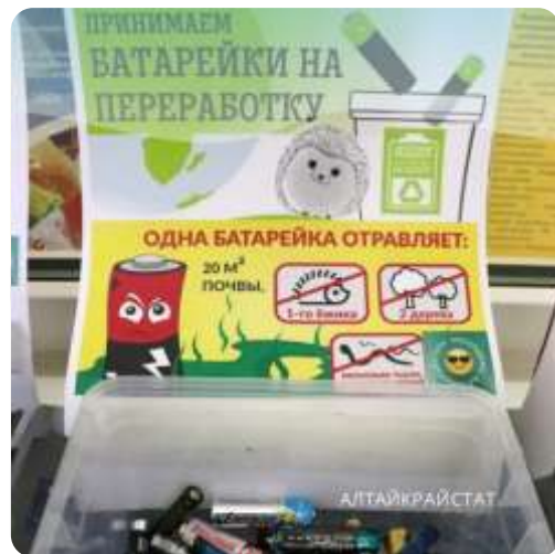
Акция по сбору использованных батареек «Батарейку принеси — ежика спаси»