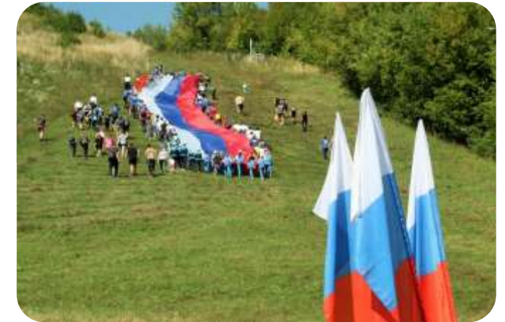
День флага РФ