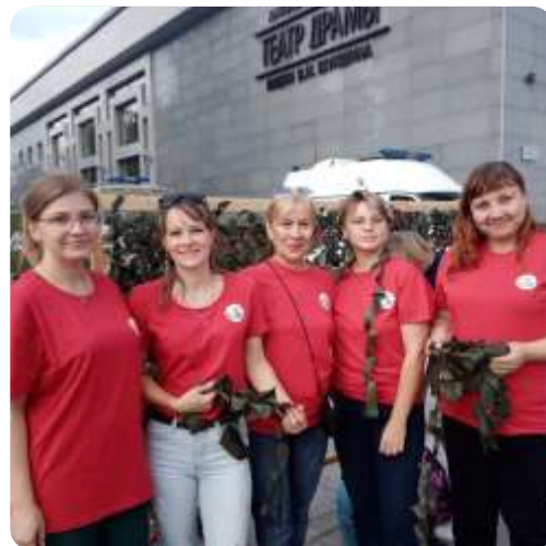
Открытый мастер-класс по плетению маскировочных сетей в день города Барнаула