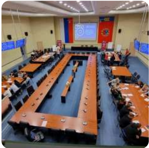
Форум советов работающей молодежи Сибирского федерального округа