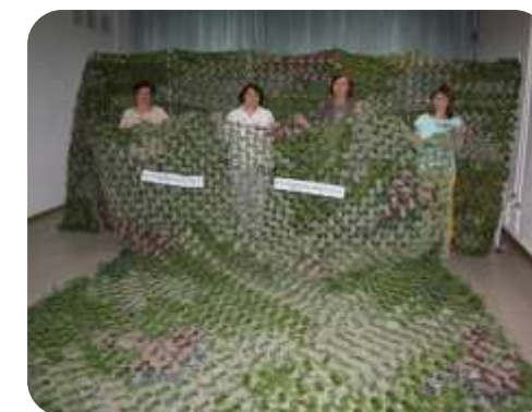
Изготовление окопных свечей и маскировочных сетей для участников СВО