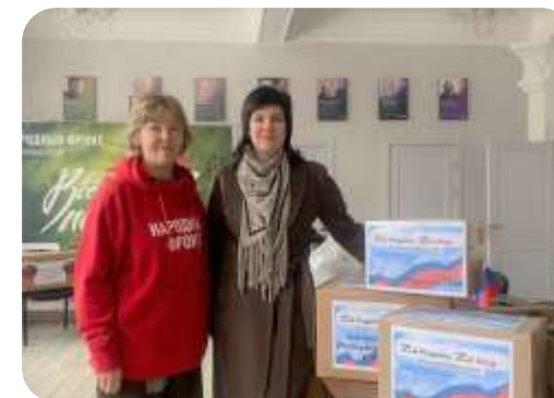
Передача гуманитарной помощи участникам СВО через ОНФ «Все для Победы!»