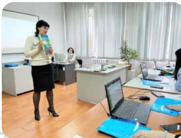
День открытых дверей для школьников и студентов