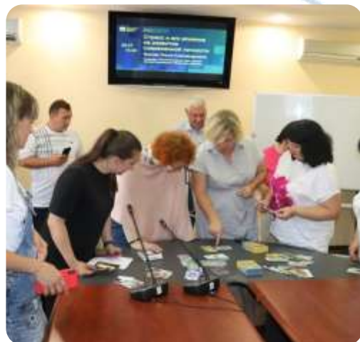
«Полезен стресс или нет? Какие факторы могут его вызвать?»