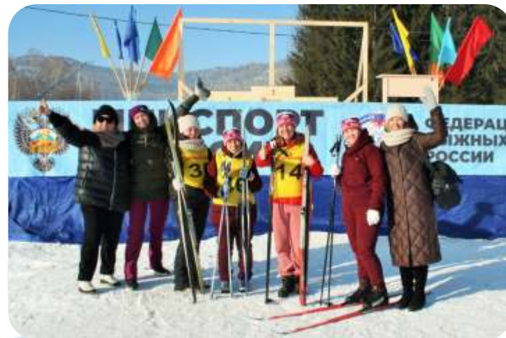
Лыжня России, 3 место