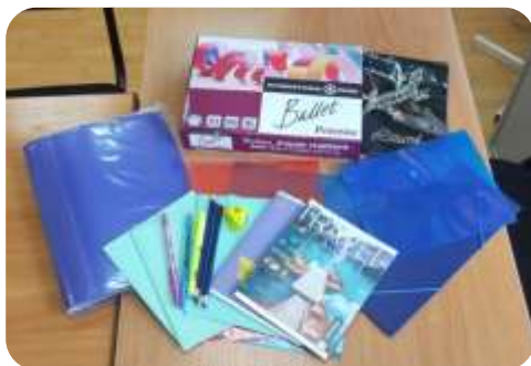
Акция «Помоги пойти учиться» для детей из малообеспеченных семей и детей оставшихся без попечения родителей