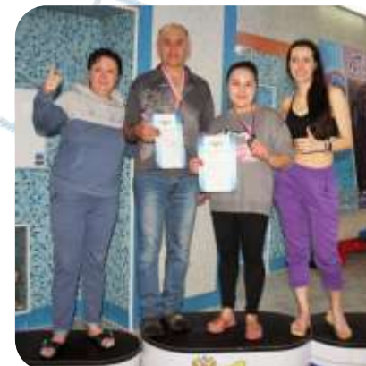
Плавание, два 3х места