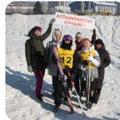
Горные лыжи, 3 место