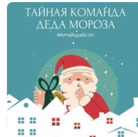
Тайная команда Деда Мороза