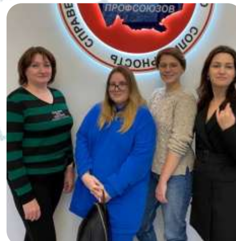
Квиз-игра «Социальное партнерство — гарантия достойного труда!»