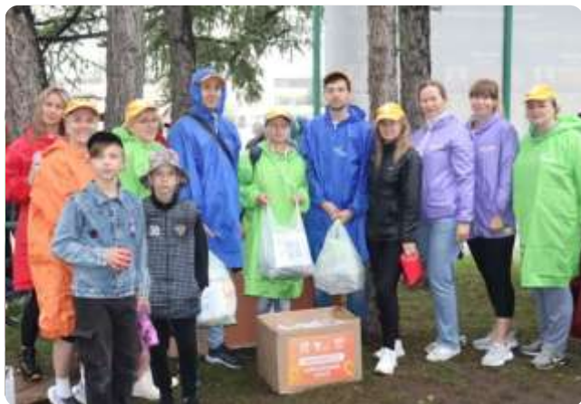
Передача спортивного инвентаря для образовательных и культурных организаций ЛНР и ДНР