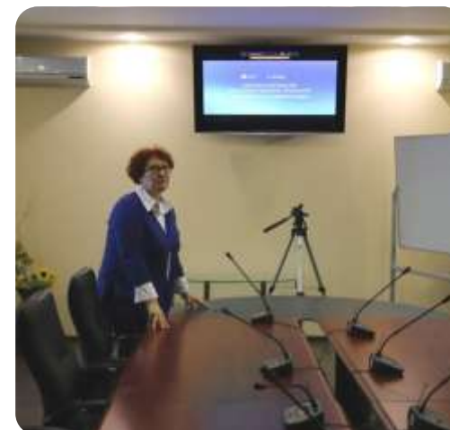
«Достижения Алтайского края»