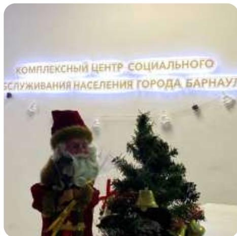
Новогодняя акция «Расхламись»